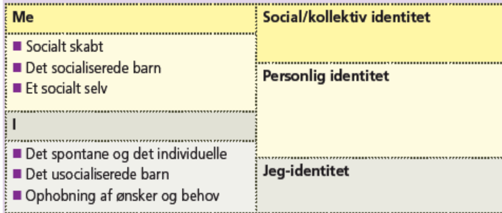
Figur 3.11 Opdelingen af identiteten i I og Me